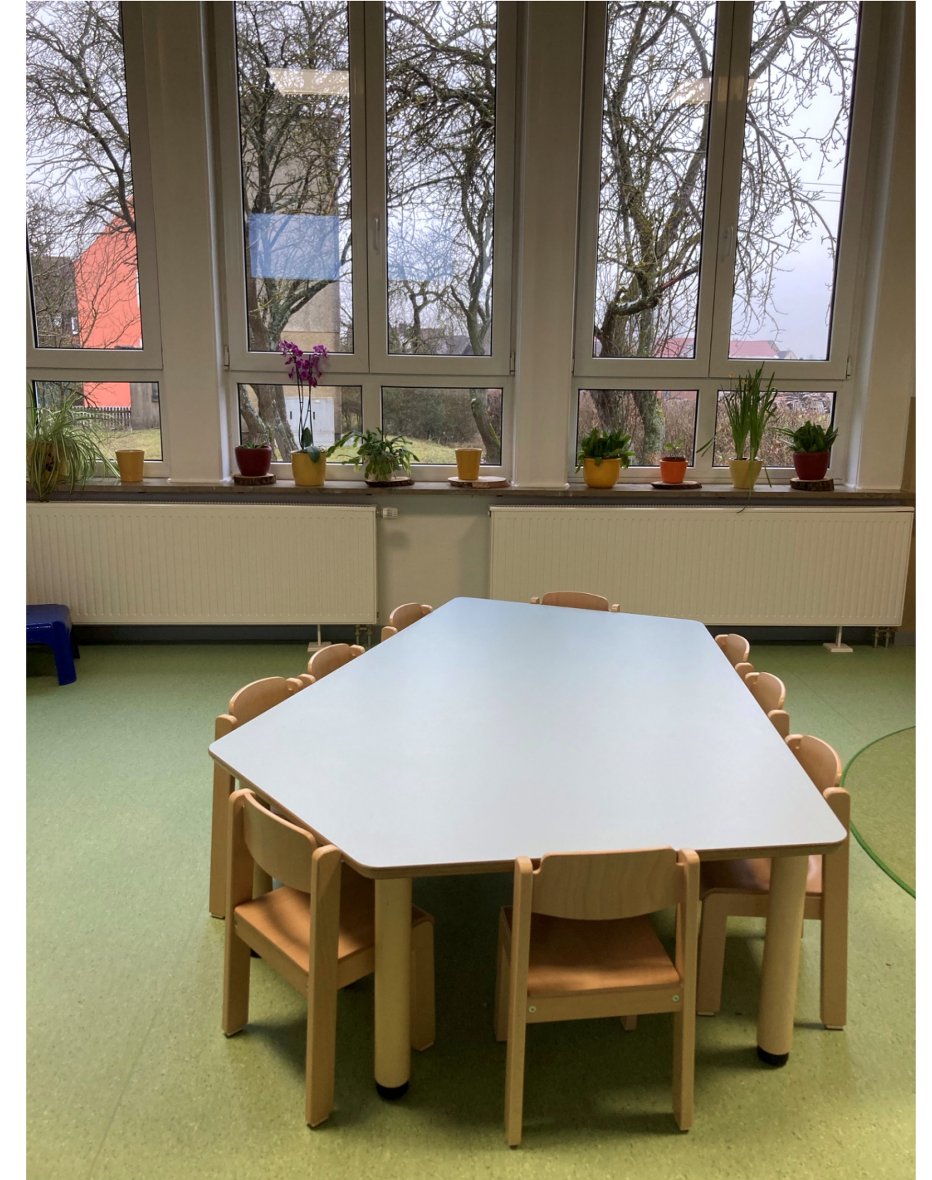
Esstisch neben der Küche