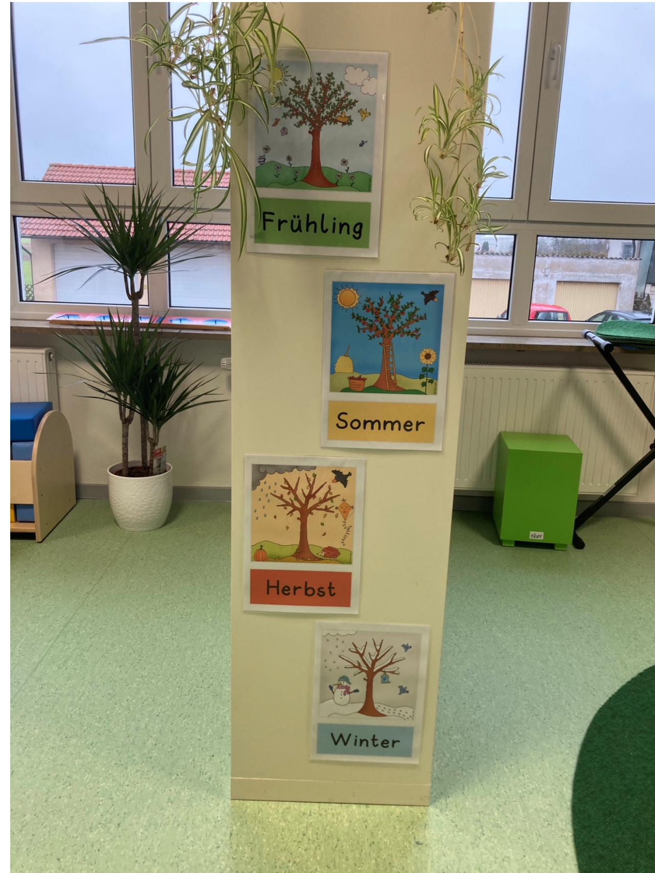
Nebenraum mit verschiedenen Bildungsangeboten, Musikinstrumenten, Büchern, Kreativarbeiten, etc.