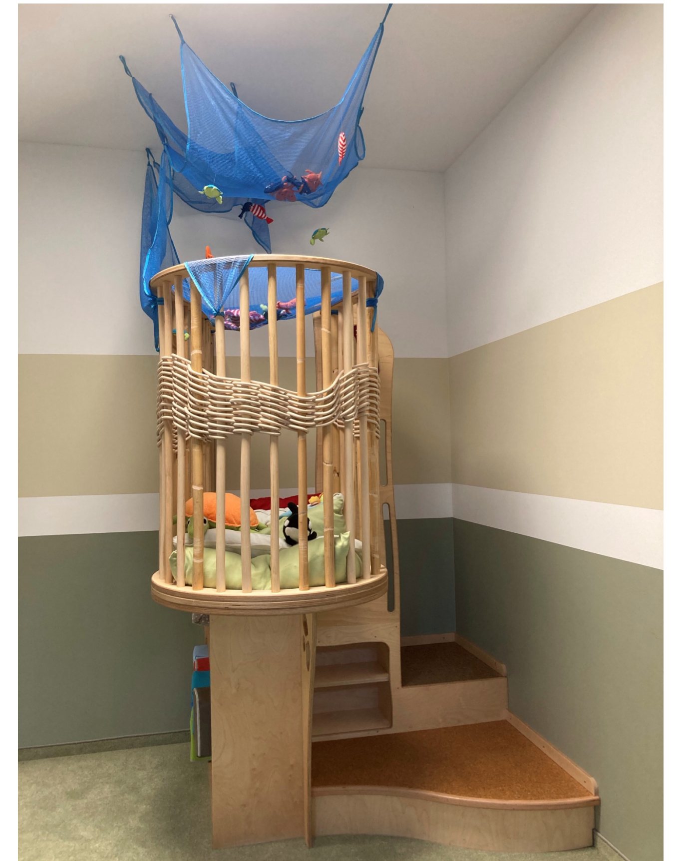
Schlaf- und Nebenraum mit flexiblen Bettchen, Softbausteinen, Wickelei, Podest, „Unterwasserwelt“