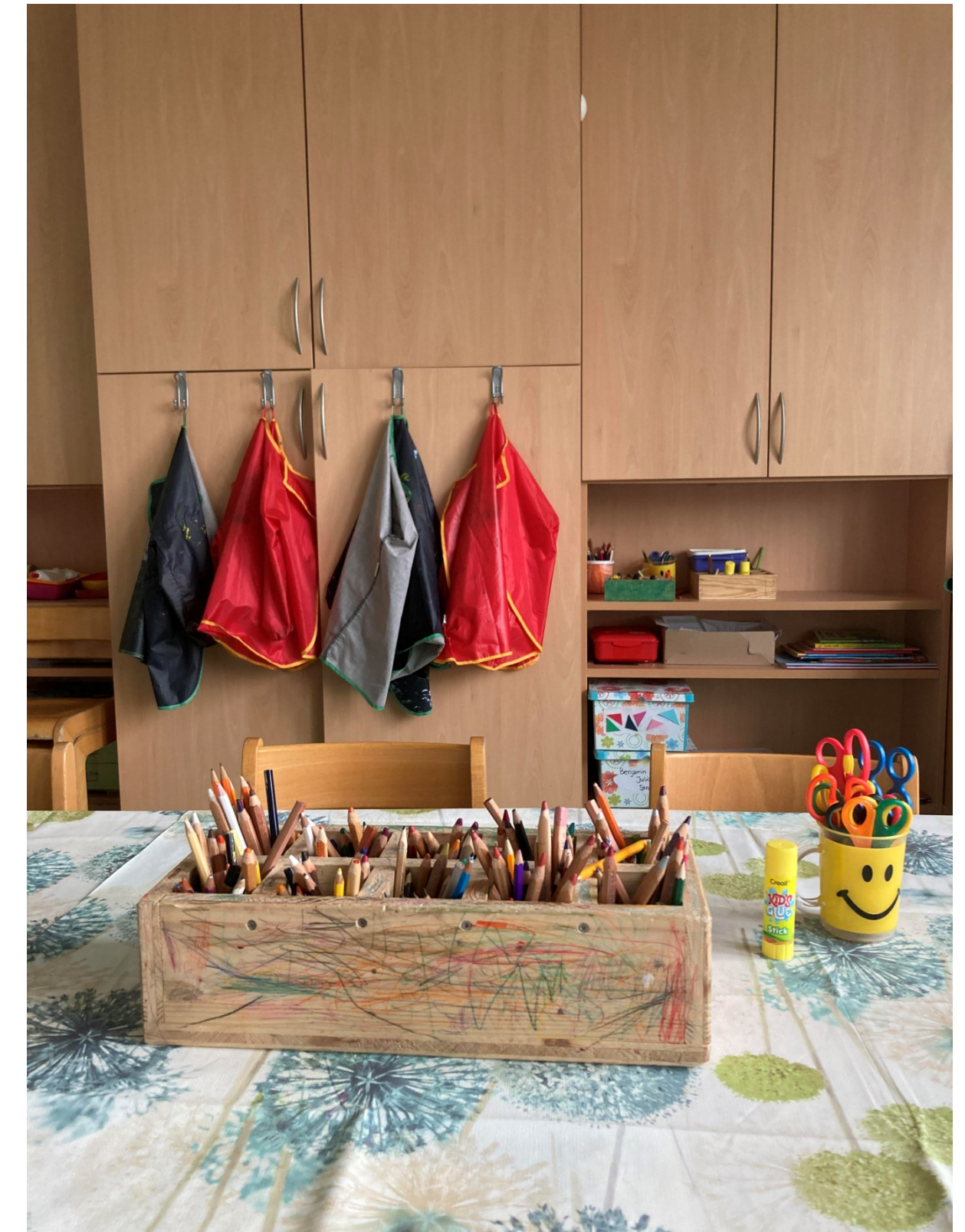
Mal- und Basteltisch