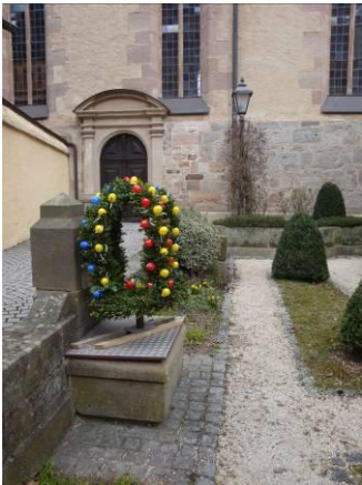
Osterbrunnen im Gärtchen