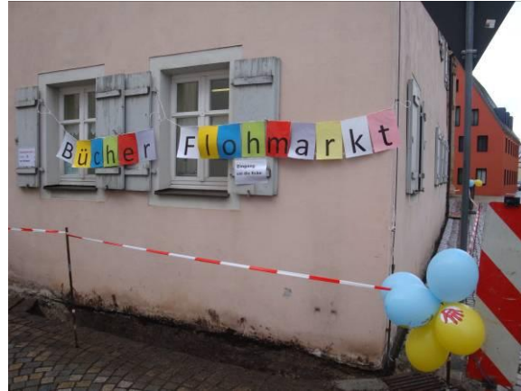
Flohmarkt unter erschwerten Bedingungen