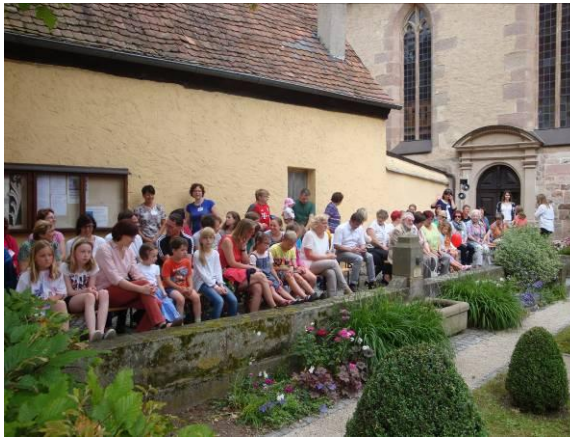
Die Zuschauer warten gespannt