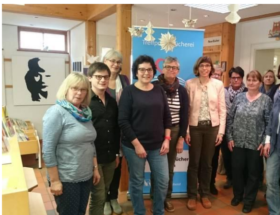
Bibliotheksleiter/innen im Landkreis Ansbach treffen sich in Herrieden