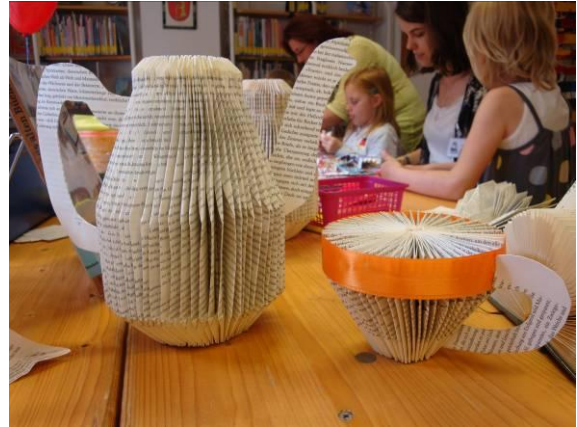
Neues aus alten Büchern