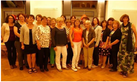
Ein tolles Team