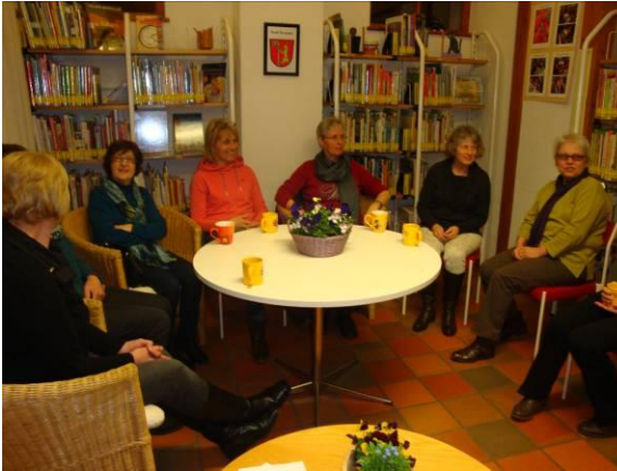
Evangelischer Frauenkreis beim Bücherabend