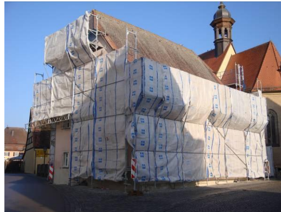
Renovierung der Außenfassade