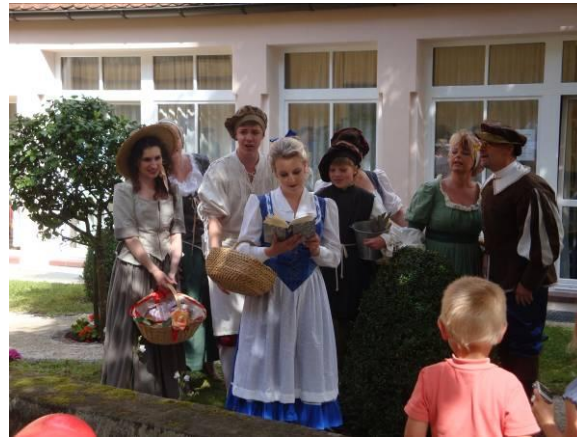
Musical im Büchereigarten