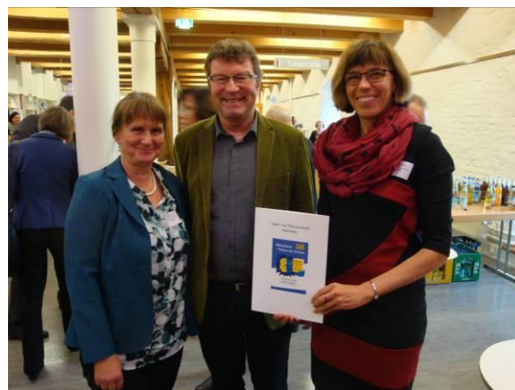
Verleihung des Gütesiegels "Bibliotheken – Partner der Schulen" in Straubing