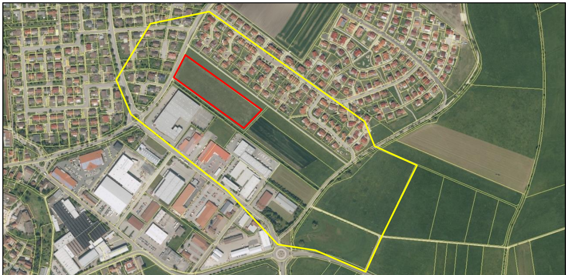
Abb. 2: Lage und Abgrenzung des Projektgebietes. Die rote Linie stellt das Grundstück des Bebauungsplanes dar. Gelb ist der Bewertungsraum dargestellt.

Das Grundstück liegt im Ortsbereich von Herrieden und ist von bestehender Wohn- und Gewerbebebauung, sowie im Südosten von intensiv genutzten landwirtschaftlichen Flächen umgeben. Auf der Fläche befindet sich intensiv genutztes Grünland, am Südwestrand eine Feldhecke.