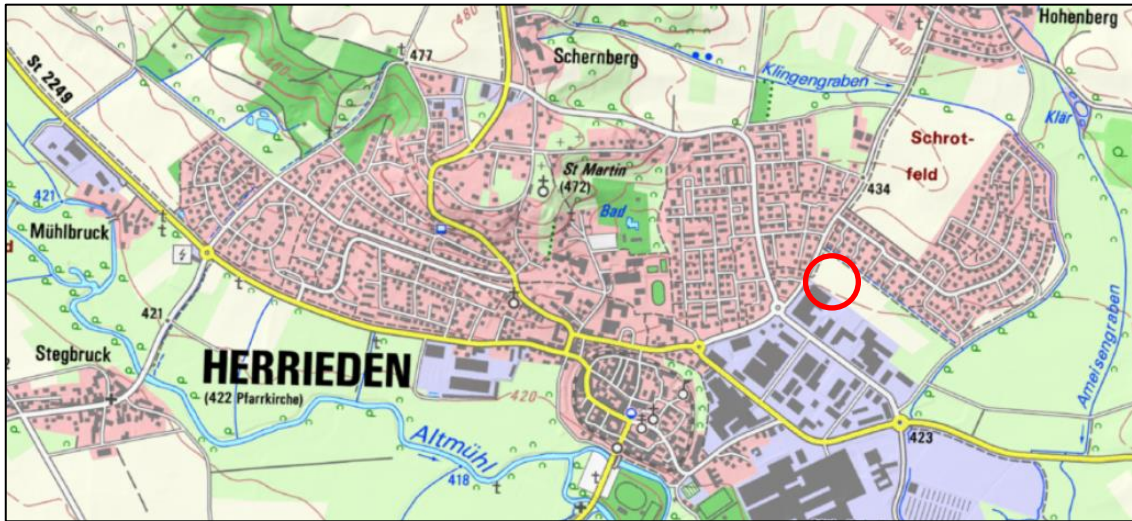
Abb. 1: Lage des Projektgebietes in Herrieden