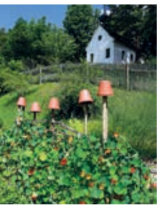
Kräuterlehrgarten | Elbersroth

AKTIV-STADT MIT LEBENDIGER KULTUR UND GESCHICHTE Herrieden blickt auf fast 1250 Jahre Geschichte. Eine Stadt mit besonderem Flair, die dem Besucher ein reichhaltiges Freizeitangebot, eine Fülle an historischen Bauwerken und interessante Sehenswürdigkeiten bietet. Ein kulturelles, schulisches und wirtschaftliches Zentrum inmitten des Landkreises. Im Gemeindegebiet liegen auch viele kleine, landwirtschaftlich geprägte Dörfer mit besonderen Kulturdenkmälern. Sehenswürdigkeiten sind z. B. die Stiftsbasilika und andere Kirchen, die Stadtmauer mit Storchenturm, das Stadtschloss, die steinerne Altmühlbrücke. Das Freizeitangebot umfasst Kräutlerlehrgarten,