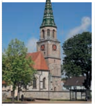
St. Vitus | Neunstetten