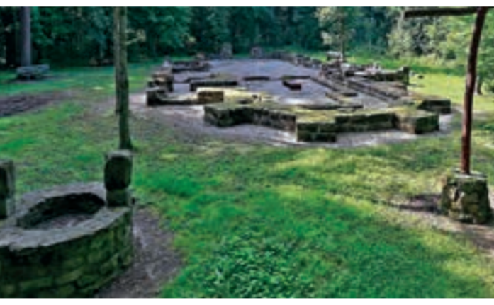
St. Salvador | Rauenzell