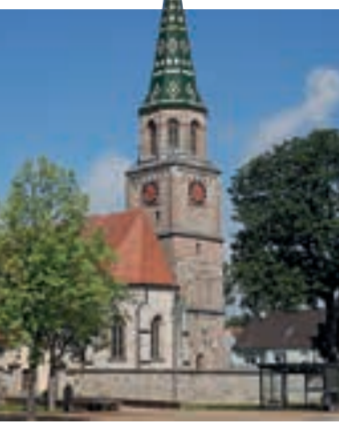
St. Vitus | Neunstetten