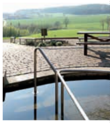
Kneippanlage | Lattenbuch