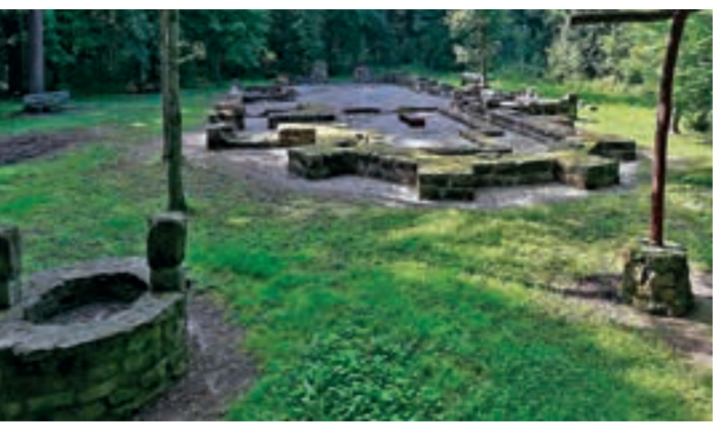
St. Salvador | Rauenzell