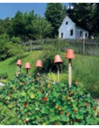
Kräuterlehrgarten | Elbersroth